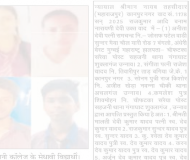
भजनलाल स्वतंत्रता संग्राम सेनानी कॉलेज के मेधावी विद्यार्थी।