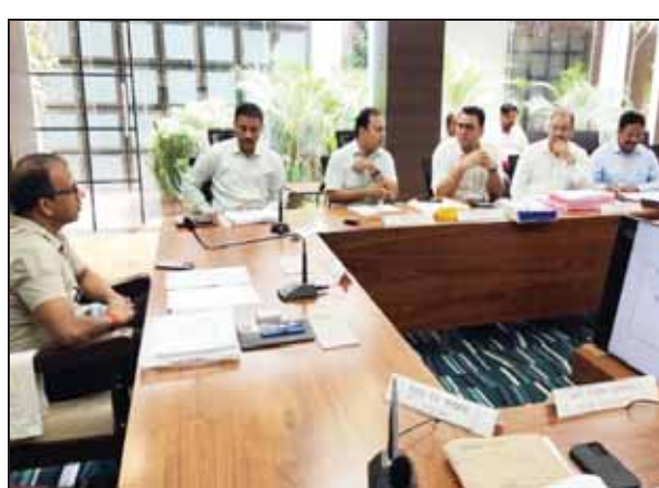
अधिकारियों संग बैठक करते कमिश्नर।

कानपुर, 4 सितम्बर। विकास कार्यों को लेकर बुधवार को मण्डलायुक्त अमित गुप्ता की अध्यक्षता में अधिकारियों के साथ बैठक हुई। इस दौरान उन्होंने कहा कि आधारभूत संरचना का वेहतर विकास व कार्य प्रणाली में नवाचार का अधिक से अधिक प्रयोग हो। साथ ही मंडल के सभी जिलाधिकारियों द्वारा अपने अपने जनपदों के कार्य प्रणाली में नवाचार का व्यापक प्रयोग किया जाए। उन्होंने निर्दिष्ट किया कि जिलाधिकारी कानपुर नगर आसरा आवास के लाभाधिकारियों को तत्काल आवास आवंटित करें। जिलाधिकारी, नगर आयुक्त व मुख्य अभियंता लोक निर्माण विभाग मेट्रो द्वारा अतिक्रमण मार्गों का अनुश्रवण करके मार्ग को मुक्त कराया जाए। मुख्य अभियंता लोक निर्माण विभाग जिलाधिकारी औरिया के वार्ता करके जनपद की क्षतिग्रस्त मार्गों को मोटेरवल कराएं। मुख्य अभियंता लोक निर्माण विभाग एवं जिलाधिकारी कानपुर नगर कल्याणपुर, शबली, शिवराजपुर मार्ग को अतिक्रमण मुक्त कराएं।