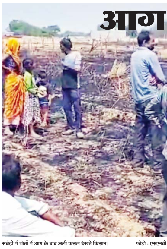
संचेडी में खेतों में आग के बाद जली फसल देखते किसान।

केडीए ने सील किया गेस्ट हाउस। कानपुर। कानपुर विकास प्राधिकरण (केडीए) ने बुधवार को डब्ल्यू ब्लॉक, जुही में भवन संख्या 744 और 744ए में संचालित दिव्यांशु गाडन गेस्ट हाउस को पुनः सील कर दिया गया है। यह कार्यवाही जेन-3 के प्रवर्तन अधिकारी और टीम ने की है। (एसएनबी)