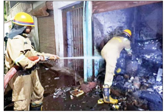
लालबंगला में परचून की दुकान में लगी आग को बुझाने दमकल कर्मियों।